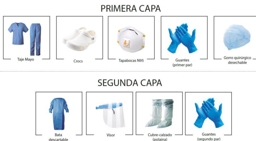
Figura 1. Elementos de protección personal para brigadista. Elaboración propia.